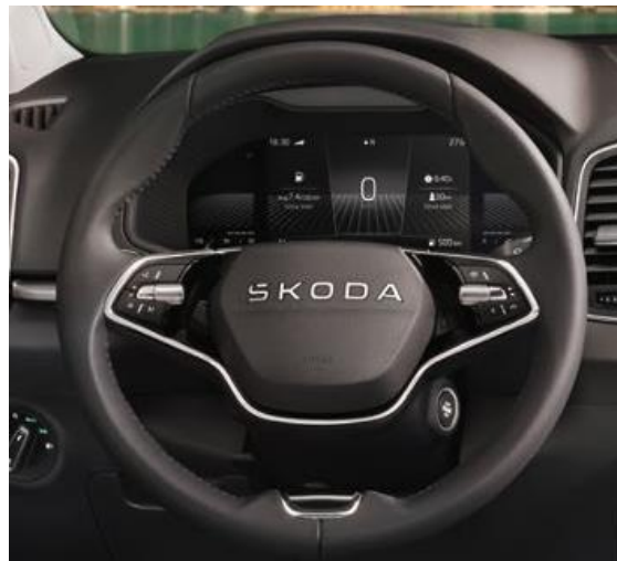
Volant multifonction 2 branches en cuir