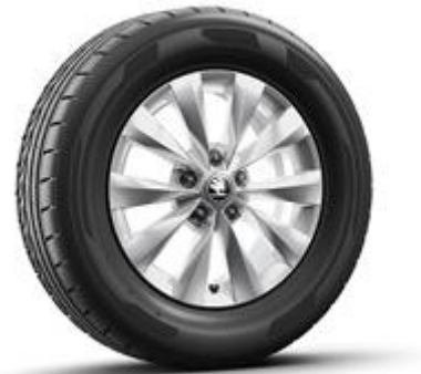
Jantes en alliage CASTOR 16" – Argent