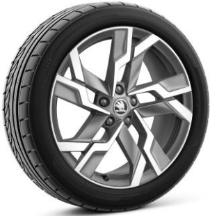
Jantes en alliage SAGITARIUS 19" - Anthracite