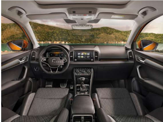
LODGE Tissu – En option