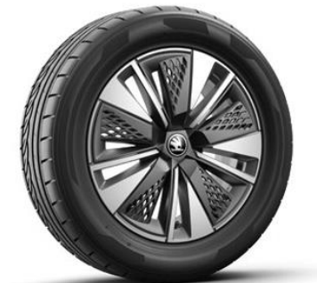
Jantes en alliage SCUTUS 17" – Anthracite