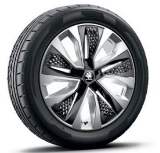
Jantes en alliage PROCYON 18" – Argent