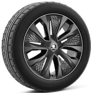
Jantes en alliage PROCYON 18" – Black