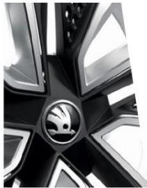
Avec AERO hubcaps - Noir Matt