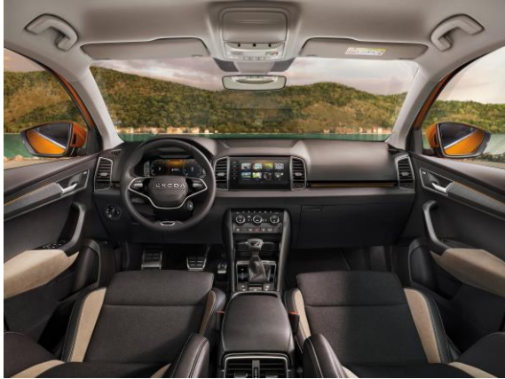
ECO SUITE Tissu – En option