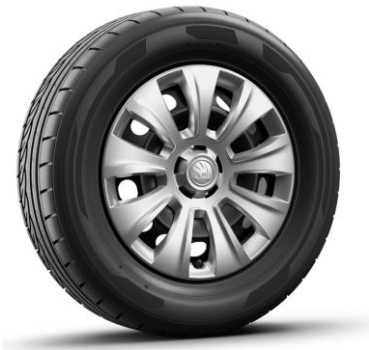
Jantes en acier BORNEO 16" – Argent