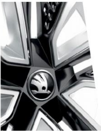
Avec AERO hubcaps - Noir