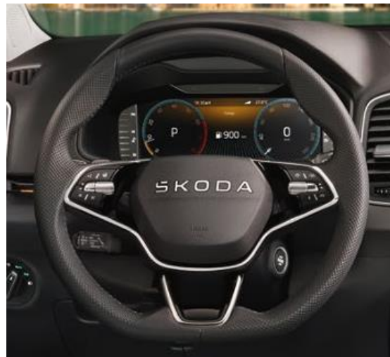
Volant multifonction sport 3 branches en cuir