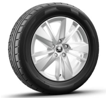
Jantes en alliage SCUTUS 17" – Argent