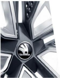
Avec AERO hubcaps - Anthracite