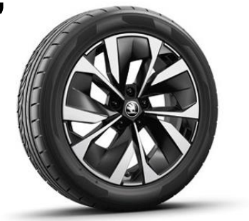
Jantes en alliage MIRAN 18" – Argent