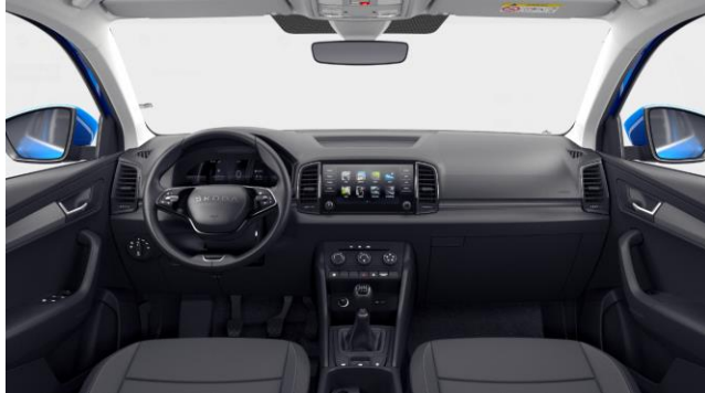
STUDIO Tissu – De série (Essence)