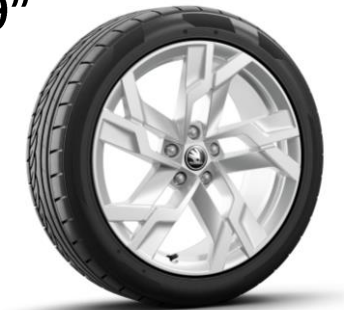
Jantes en alliage SAGITARIUS 19" - Argent